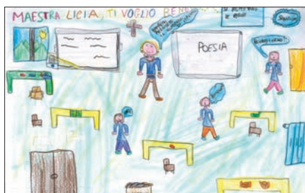
Immediata Giorgia Maria - Circolo didattico, Montecorvino Rovella